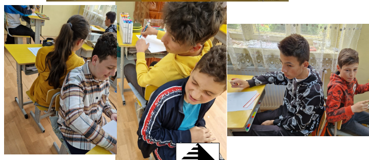
Școala Gimnazială Surdila Greci

strada Școlii, nr. 9, Surdila Greci, județul Brăila telefon/fax 0239 661 010 email scoalasurdilagreci@yahoo.com website: https://scoalasurdilagreci.weebly.com/